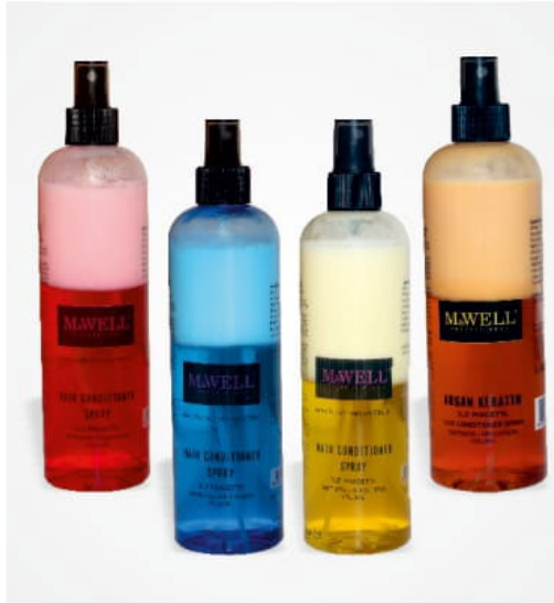
Saçta nem dengesini koruma Поддържане на баланса на влагата в косата Maintaining moisture balance in hair