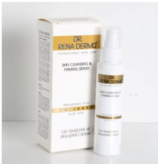
%100 doğal cilt arındırıcı 100% Naturalna формулировка 100% Natural skin purifier

Гелообразен дезинфектант за почистване на ръце