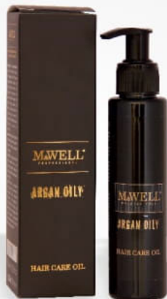
Doğal saç bakım Естествена грижа за косата Natural hair care

Двуфазен спрей-балсам за коса, осигуряващ ефективна защита за косата при топлинна обработка. Подпомага за по-лесно разресване на косата и я прави по-мека. Възстановява увредените участъци и предпазва косъма от накъсване и наелектризиране