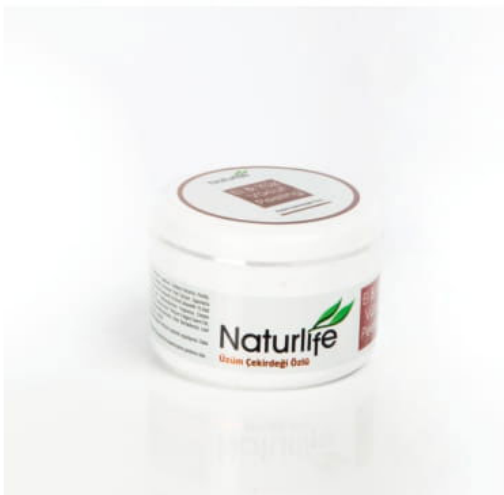
Üzüm çekirdeğinden gelen özel formül Специална формула от гроздови семки Special formula from grape seed

Клинично доказан продукт против появата на бръчки в зоната около очите.