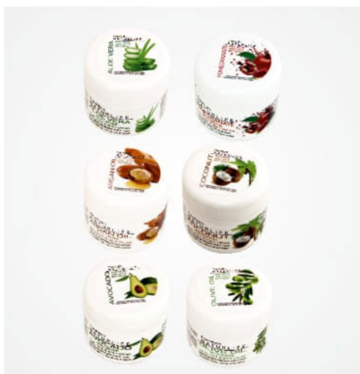
Parafin içermez / Не съдържа парафин / Paraffin free