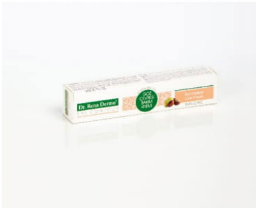
Göz altı problemlerine test edilmiş özel formül За проблеми под очите тествана специална формула For under eye problems tested special formula

Благодарение на специалните си съставки като : Tyrostate , екстракт от магданоз , екстракт от лимон и други билки , подпомага за регулирането на недостатъците по кожата. Др.Рено Дермо е ефективен за проблеми с акне като почиства кожата в дълбочини