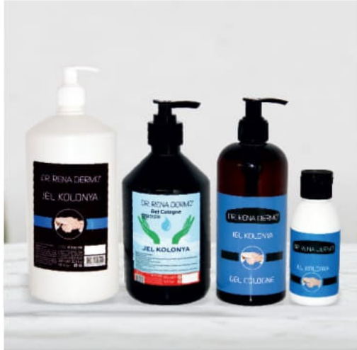
Anti-Bakteriyel Anti-Bacterial • Анти-бактериален