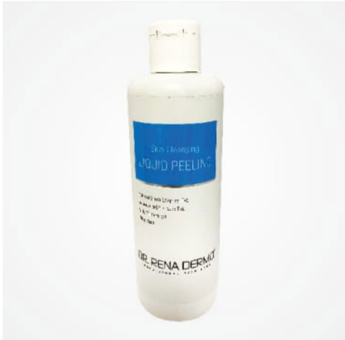
Whiting plus özel formül peeling Специална пилинг формула Whiting plus special peeling formula